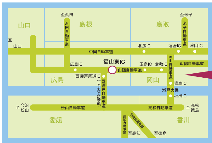
広域高速道路地図